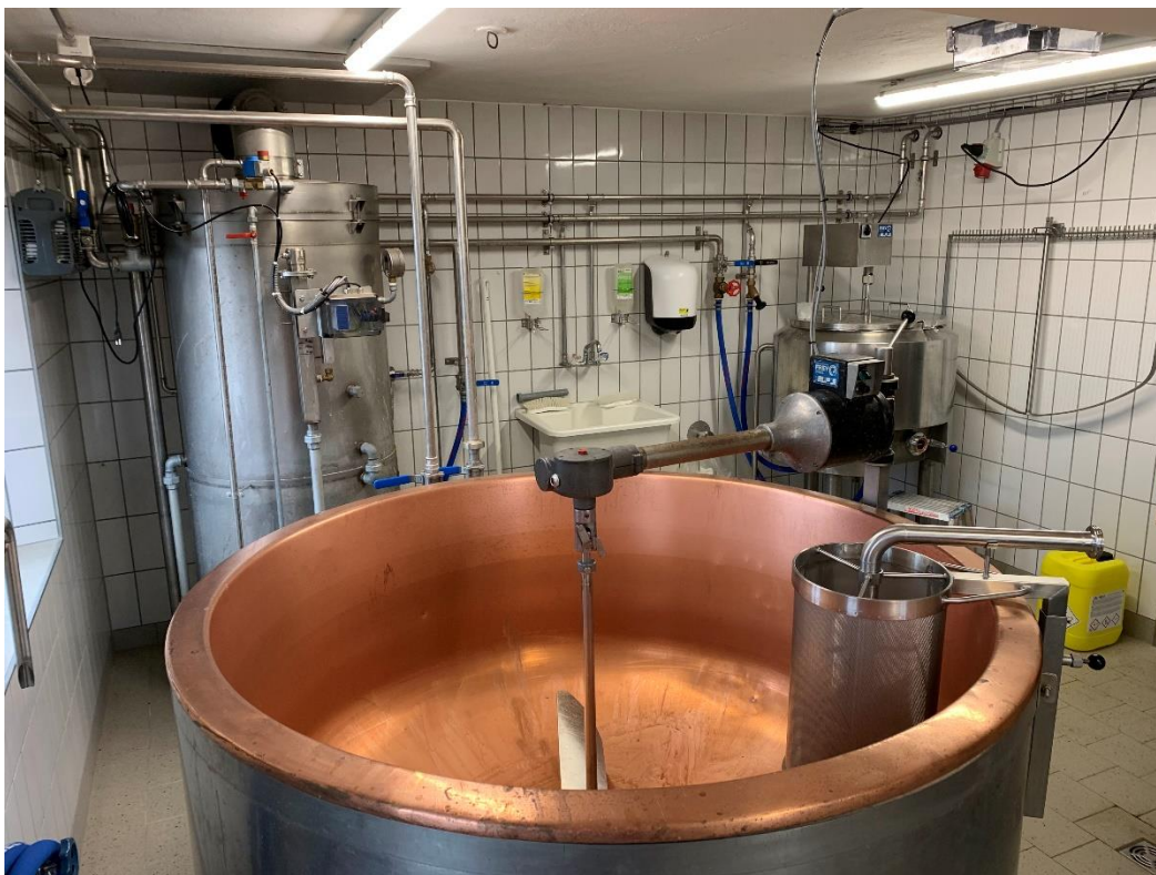
Sanierte Alpkäserei Kienberg mit neuem Käsekessi