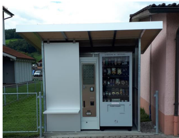
Warenautomat an der Staatsstrasse 105

Um einem oft geäusserten Kundenwunsch entsprechen zu können, hat sich der Ortsverwaltungsrat Oberriet entschieden, einen Warenautomaten zu erwerben, der